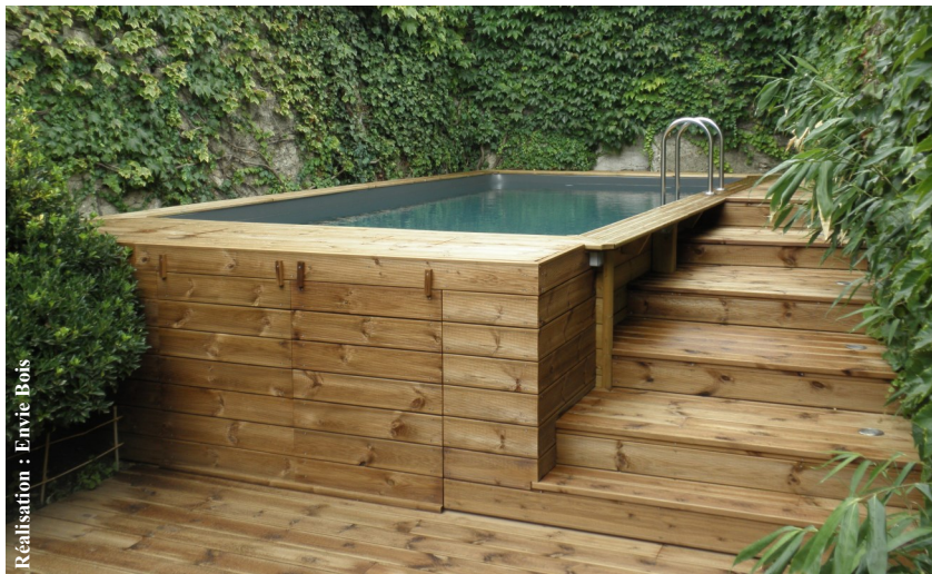
Réalisation : Envie Bois

Pin du Nord traité par autoclave aspect vert ou aspect marron.